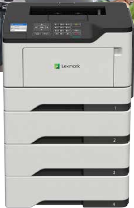
M1246 mit optionalen Fächern